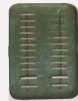
Boîte à aiguilles radioactives.