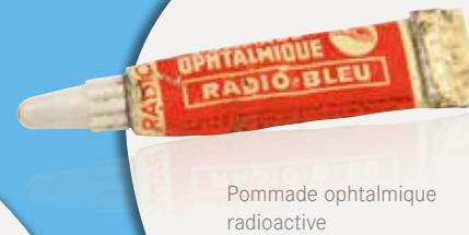
Pommade ophtalmique radioactive