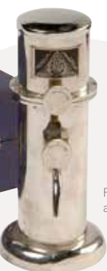
Fontaine au radium