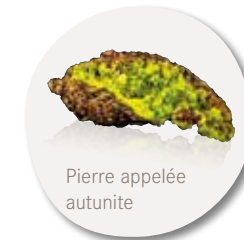
Pierre appelée autunite