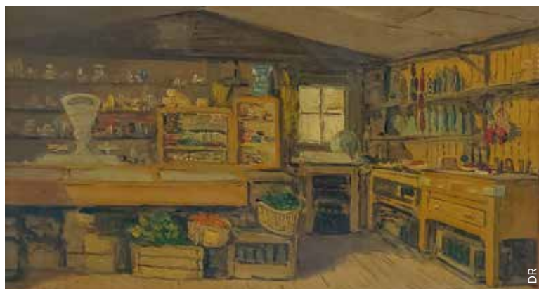
L'intérieur de La Cabane, peint par Gaston Pottier. Le troisième tableau représente le zinc du bar.