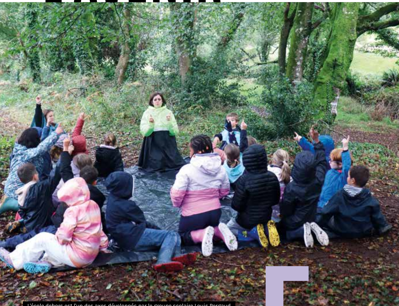
L'école dehors est l'un des axes développés par le groupe scolaire Louis Pergaud via leur projet d'école, avec l'accompagnement de la Ville de Guipavas.