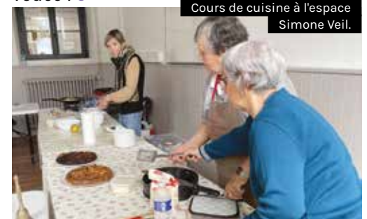
Cours de cuisine à l'espace Simone Veil.

Avec un abonnement de 40 € pour les adhérents (26 € pour les bénévoles), l'AVF vous ouvre les bras pour une intégration réussie à Guipavas ! Et si vous cherchez un atelier mémoire, la doyenne de l'association, 94 ans, en est l'animatrice dévouée ! ●