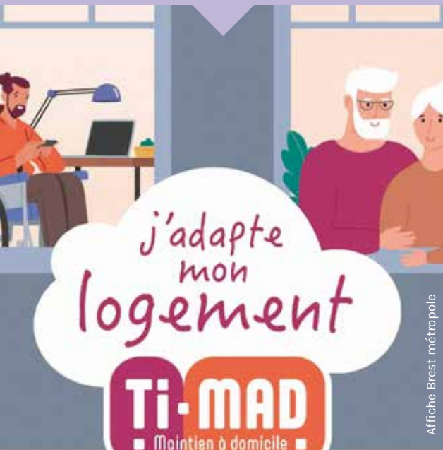
Affiche Brest métropole

Rens. auprès du CCAS au 02 98 42 71 38 ou ccas@mairie-guipavas.fr