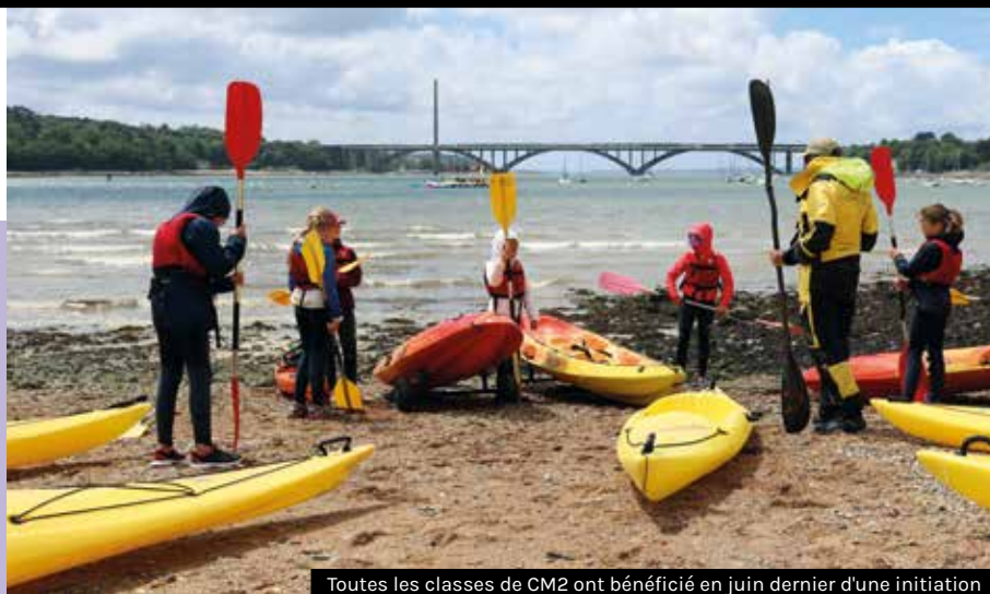
Toutes les classes de CM2 ont bénéficié en juin dernier d'une initiation aux sports nautiques. Ce projet financé par la Ville est reconduit cette année.

Lancé en mai dernier pour la première fois, l'activité voile pour les élèves en cycle 3 est renouvelée cette année. Ainsi, les élèves en CM2 des quatre groupes scolaires publics vont bénéficier comme leurs camarades de l'année dernière d'une initiation aux sports nautiques. Elle se déroulera sur quatre jours en mai ou juin prochain. Au programme : kayak, paddle, funboard, encadrés par le centre nautique SNRK du Relecq-Kerhuon, dans le but de découvrir le fond de la rade avec des objectifs pédagogiques et ludiques. Le coût de l'activité et le transport en car (30 000€) est entièrement pris en charge par la Ville. La Ville accompagne également les écoles dans leurs projets en sollicitant notamment des aides auprès du Conseil régional. L'année