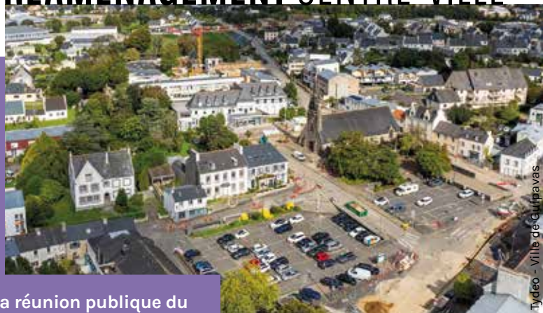
Tydeo - Ville de Guipavas

Suite à la réunion publique du 13 mai 2024, présentant l'avant-projet de réaménagement du centre-ville, la question du stationnement avait soulevé de nombreuses interrogations de la part des habitants.