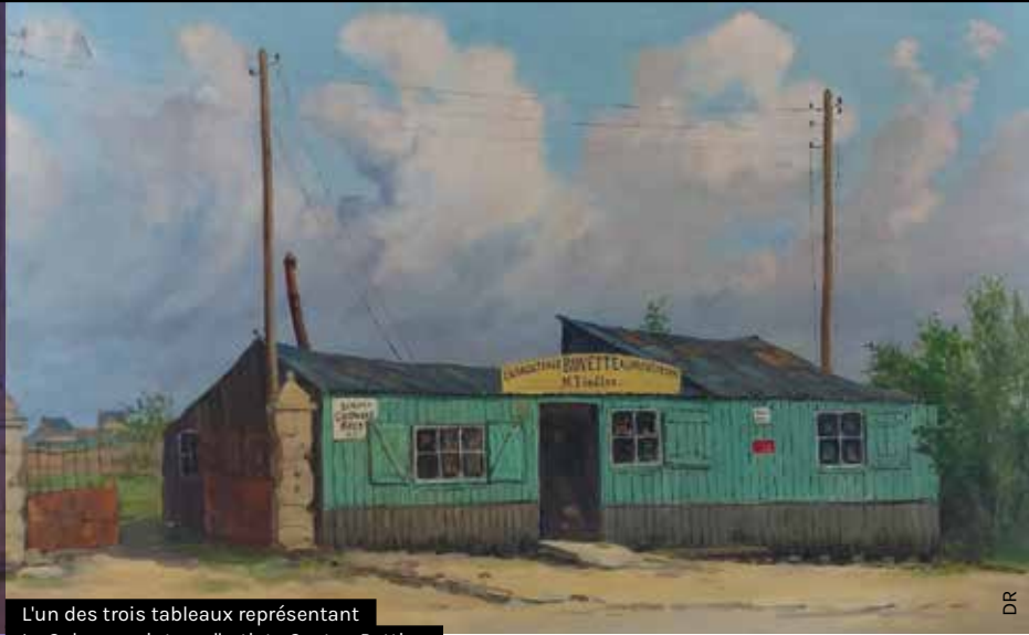
L'un des trois tableaux représentant La Cabane peint par l'artiste Gaston Pottier.