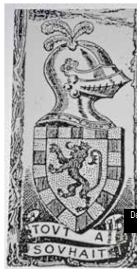
Devise du Seigneur de Coataudon surmontée de son blason

Lors de la Révolution, la chapelle devient un corps de garde pour les soldats