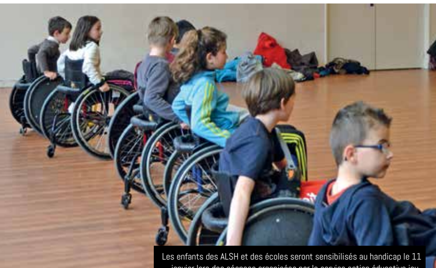
Les enfants des ALSH et des écoles seront sensibilisés au handicap le 11 janvier lors des séances organisées par le service action éducative jeunesse (AEJ) en partenariat avec la fédération française handisport (FFH)

La ville de Guipavas initie, avec l'aide d'une quarantaine de partenaires, du lundi 9 au samedi 14 janvier 2017, une semaine de sensibilisation au handicap. Le programme qui comprend de nombreux temps forts : échanges, expositions, animations, séance de cinéma, etc., vise autant à informer les personnes en situation de handicap qu'à sensibiliser et faire évoluer le regard du grand public.