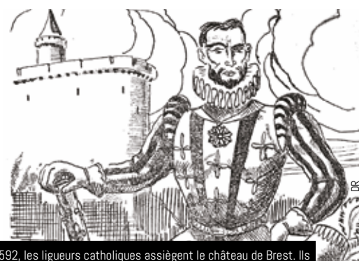
En 1592, les ligueurs catholiques assiègent le château de Brest. Ils seront massacrés par le gouverneur Sourdéac qui impose une trêve

le duc de Mercœur, fer de lance de la Ligue catholique de Bretagne se soumit au roi Henri IV qui promulgua l'Édit de Nantes accordant aux protestants la liberté de suivre leur religion