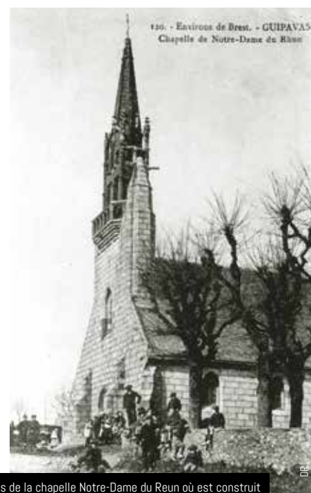
Le terrain près de la chapelle Notre-Dame du Reun où est construit la mairie s'appelait le « Parc a Bastil » (le champ de la Bastille)