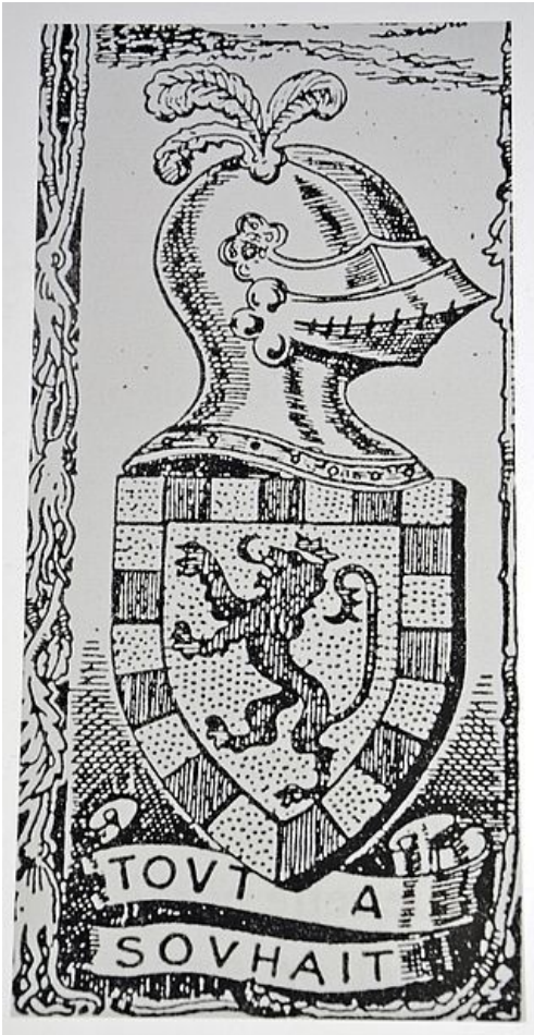
Devise du seigneur de Coataudon surmontée de son blason

"C'était un lieu inconnu, inaccessible aux hommes, environné de brousses et d'arbres que dominait l'épaisse forêt de Bévoes dont il occupait le centre. Il était en face de la forêt de Salomon, située de l'autre côté de l'Elorn et couverte également de halliers".